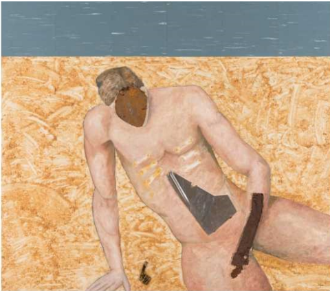
L'homme mutilé Acrylique, métal recyclé et linoléum sur toile 1990 1,52 x 1,82 m Don Ville de Saint-Georges