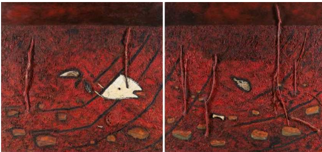
Altered nature Objets trouvés, bran de scie et acrylique sur toile 1991 1,53 x 3,64 m Don Ville de Saint-Georges