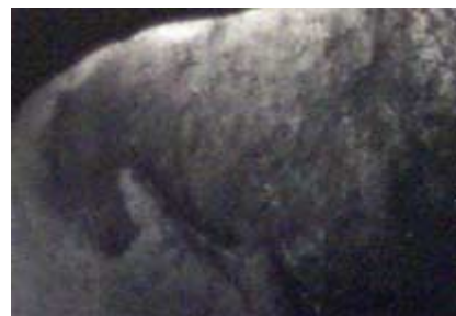
Le cheval de pierre Photographie 1995 48 x 35 cm Don de l'artiste