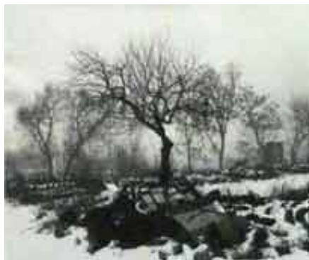
Un pommier sans avenir Photographie 1992 47 x 39 cm Achat par la Collection